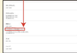
お問い合わせページ

アクティビティページ、西表スパページ、 その他ページに設けられた、 「予約する」リンクを押します。